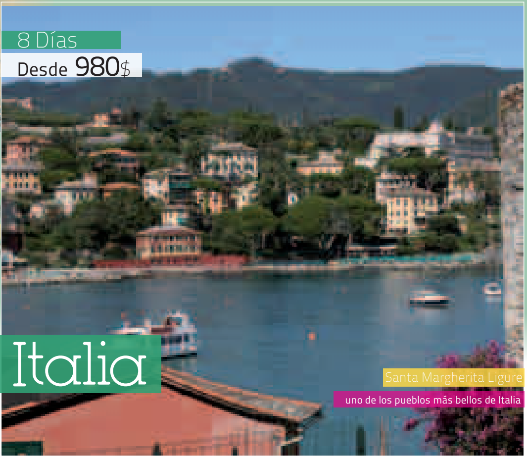
Santa Margherita Ligure